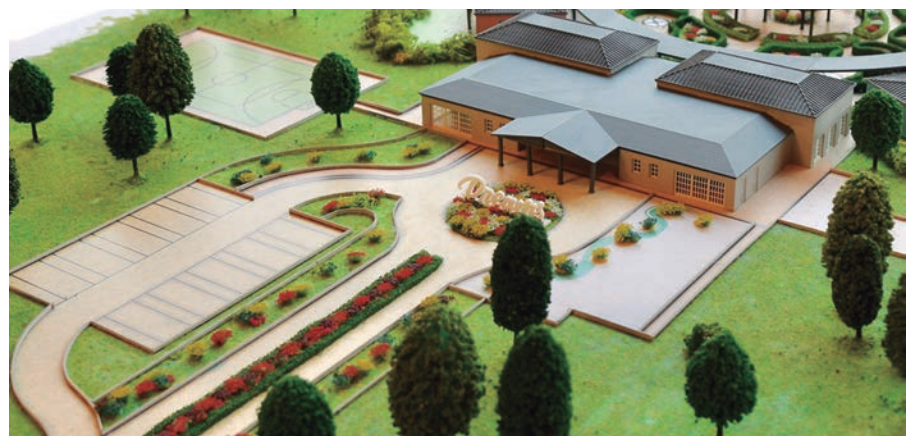
El projecte contempla la construcció d'habitatges unifamiliars, àrees comunes i zones verdes

La Fundació PortAventura és l'entitat que canalitza i impulsa totes les accions socials de PortAventura World com a part de la seva proposta de Responsabilitat Social Corporativa. Des de 2011 ha concedit ajudes per valor de més de 6.300.000 euros a través de diferents projectes propis o en col·laboració amb altres entitats, i ha convidat a més de 68.000 nens i joves en risc d'exclusió a gaudir de PortAventura World.