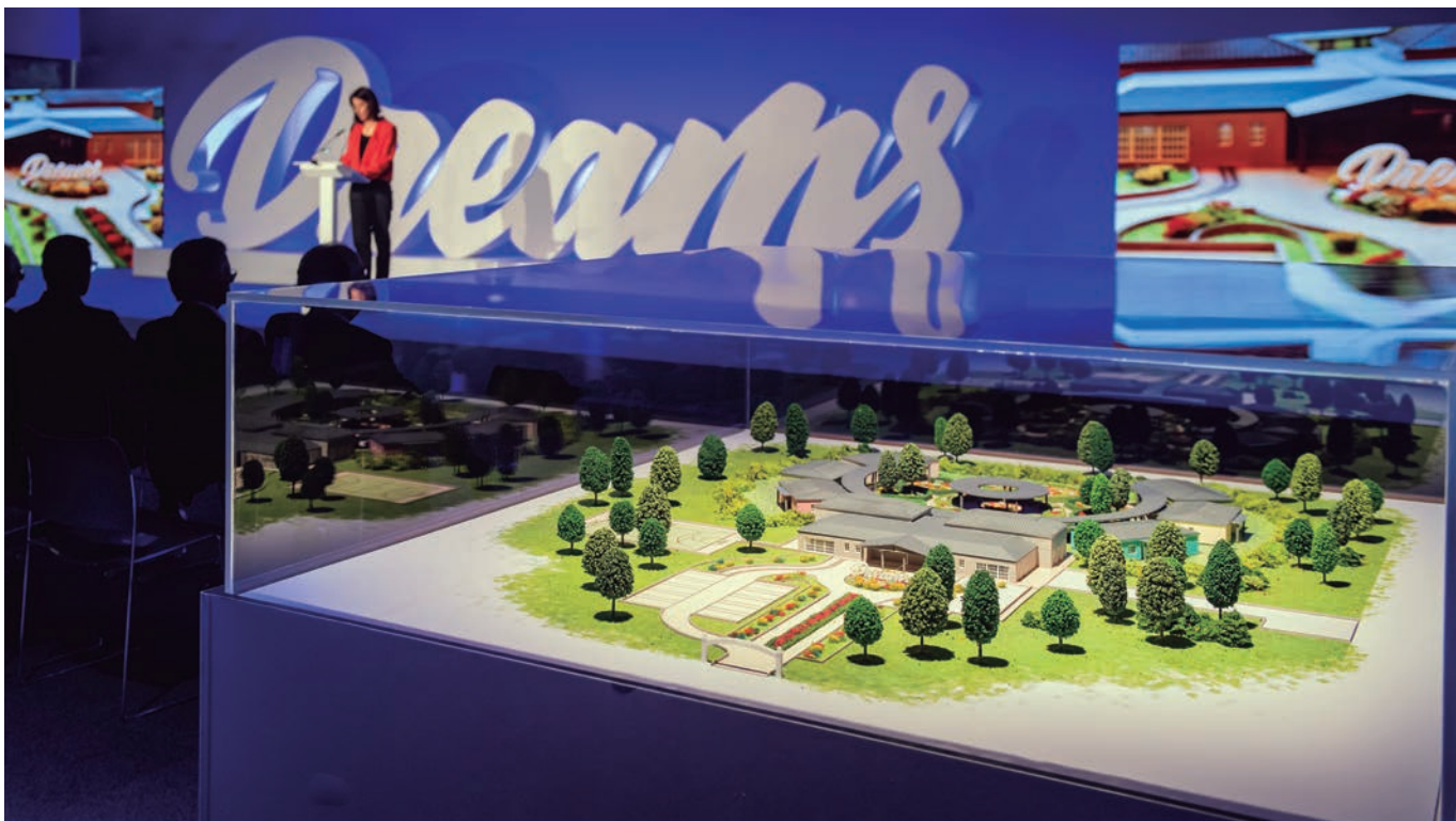
Imatge de la presentació de PortAventura Dreams

Amb l'objectiu de fomentar el valor d'oci en la teràpia de recuperació, ha nascut PortAventura Dreams village, un espai de prop de 9.000 metres quadrats que s'està construint a l'interior del ressort del parc temàtic. La iniciativa, impulsada directament per la Fundació PortAventura, pretén oferir una experiència única i diferent als nens i adolescents que pateixen malalties greus. Les obres de construcció del futur complex terapèutic i solidari ja són en marxa. El projecte té el suport de partners de primer nivell i podria ser una realitat el proper mes de setembre. Fa ben poc s'ha presentat a la societat i nosaltres en coneixem més detalls a continuació, conversant amb el president de la Fundació PortAventura, Ramon Marsal.